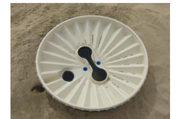
30. Remplissez ensuite le Groasis Waterboxx® avec 16 litres (4 gallons) d'eau