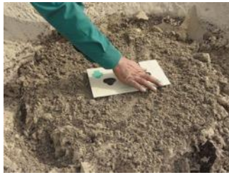
16. Placez le couvercle anti-évaporation dans une direction est-ouest