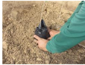
18. Vous placez l'arbre avec le sac puis retirez le sac