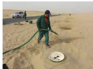
28. Ensuite, vous commencez à donner de l'eau