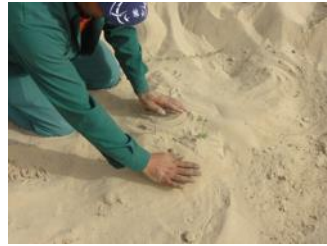
22. Ajoutez 10 cm (4 pouces) de terre uniquement sur le couvercle anti-évaporation avant de placer le Waterboxx®