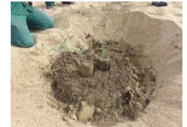
20. Vous mettez les racines des plantes tout le chemin dans le sable - sur cette photo, elles sont plantées au-dessus du sable, c'est faux