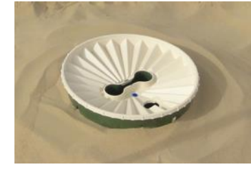
25. Mettez du sable autour de la boîte