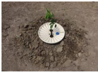
26. Libérez le sol autour de la boîte pour tuer l'herbe et emprisonner l'eau capillaire