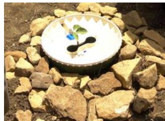
27. Si vous avez des pierres disponibles, couvrez le sol