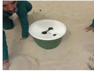
23. Ensuite, vous placez le Groasis Waterboxx® sur les arbres