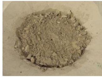
17. Déterminer la conception de la distance de plantation dans une direction est-ouest