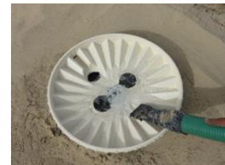
29. Versez indirectement 4 litres (1 gallon) d'eau dans l'ouverture centrale. N'érode pas le sol aux racines des arbres en versant de l'eau directement dessus.