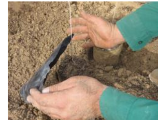
19. Pendant la plantation, retirez le plastique