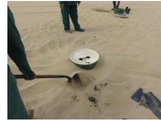
24. Put sand around the box