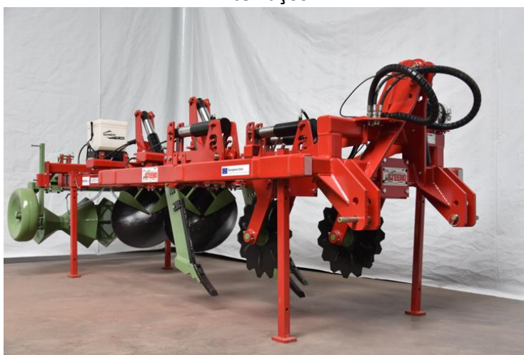
Groasis Terracedixx para abrir 15.000 metros de terraços por hora.