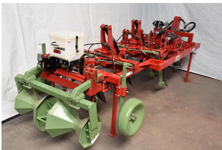
Groasis Terracedixx semeia ervas imediatamente nos terraços.

A máquina oferece a possibilidade de semear imediatamente na crosta (Alfafa / Miscanthus - Grama de elefante e todos os tipos de outras gramíneas resistentes à seca / Cannabis sativa - Cânhamo industrial (embora isso não seja maconha, a semeadura pode ser ilegal em alguns países) ) / Semente oleaginosa / Rabanete / Milho Japonês / etc.). Um tambor pesado pressiona a semente na crista para melhorar a capilaridade para estimulando a germinação.