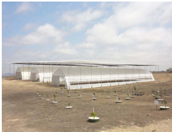
Proyecto 'Agua Vida Naturaleza', Río Verde, km 33 vía Salinas - Apartado postal 09-01-11258 - Prov. de Santa Elena - Ecuador – REP202-2 www.fuente-de-vida.com